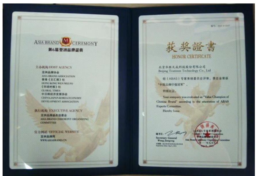
「中國品牌價值冠軍」- 獲獎證書