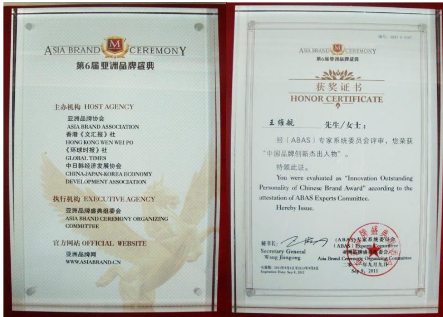
「中国品牌创新杰出人物」- 获奖证书