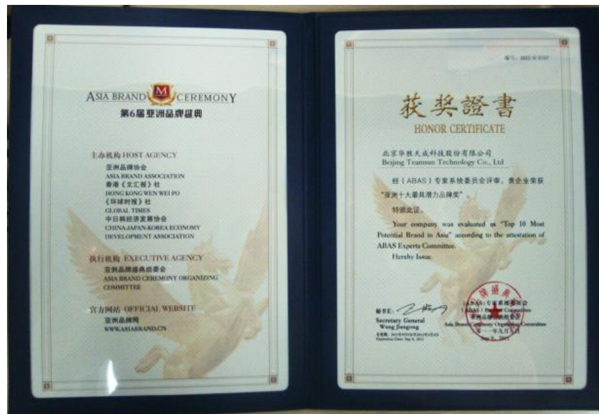
「亚洲十大最具潜力品牌」- 获奖证书